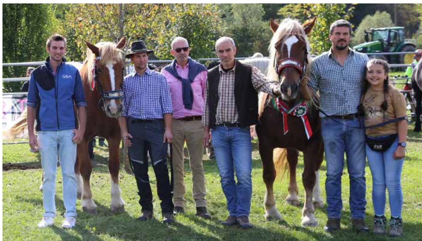
Da destra, la reginetta e la riserva Noriker a Castelnuovo

nella gestione delle varie banche dati fra servizi veterinari, ANA, APA (per noi FPA).