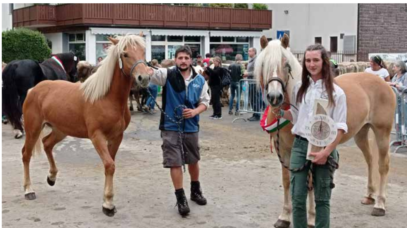
Da destra, la reginetta e la riserva Haflinger a Fiera di Primiero

Altri due appuntamenti di successo sono stati allestiti alla fine di agosto a Strembo in Rendena ed alla fine di settembre a Masi di Cavalese. Entrambe le manifestazioni sono state gestite da locali comitati di allevatori che si rapportano direttamente con le rispettive ANA di razza.