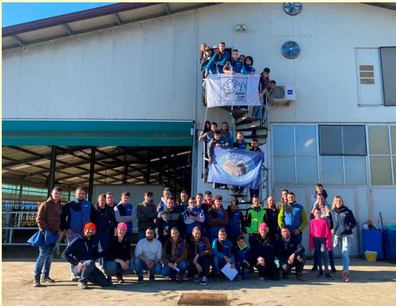
Tutto il gruppo alla Vanzetti Holstein

giudizio in mostra. Dopo la spiegazione i padroni di casa hanno messo in movimento 4 animali simulando la valutazione di una categoria di animali in mostra. I nostri giovani sono stati propositivi verso questa iniziativa e tutti hanno voluto provare a stilare la classifica, e i più coraggiosi a motivarla anche a voce, in questo modo hanno potuto essere corretti con spiegazione da parte di Piola. Finita la parte di esercitazione si è passati alla visita dell'azienda, circa 100 vacche in latte, con mungitura tradizionale. Anche in questa azienda i ragazzi hanno apprezzato l'elevato livello morfologico degli animali e hanno potuto vedere la parte di struttura in cui sono allevati gli animali più meritevoli che parteciperanno ai futuri show.