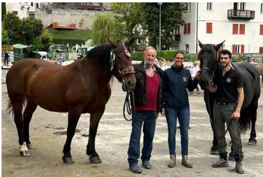
Da destra, la reginetta e la riserva Noriker a Fiera di Primiero

In Valsugana invece la rassegna, tenutasi alla metà di ottobre, ha quest'anno ripreso una tradizione con una storia solida, di buona parte-