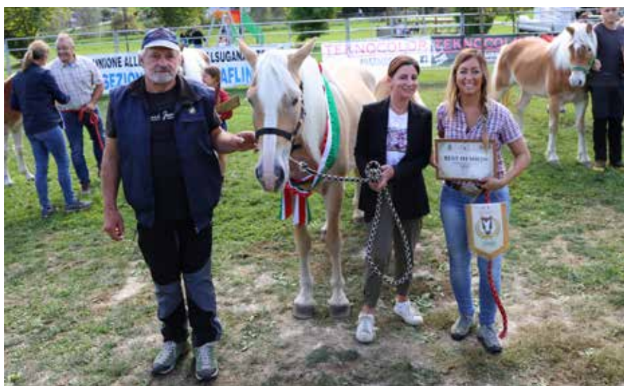
NARNJA la Best in show Haflinger a Castelnuovo

Gli ultimi anni hanno portato anche per le attività che coinvolgono gli allevatori dei cavalli Haflinger e Noriker, iscritti ai rispettivi libri genealogici, tante novità. È forse definitivamente finito il periodo d'oro quando l'attività di selezione era in espansione e quindi chi aveva già costruito un patrimonio genetico di pregio poteva ricavarne adeguato tornaconto economico: diversi allevatori avevano infatti concretamente fatto della loro passione un'attività imprenditoriale. Poi anni decisamente più difficoltosi, in coincidenza con la ristrutturazione delle associazioni di razza, rese indipendenti dalle associazioni provinciali; di fatto anche con una drastica riduzione