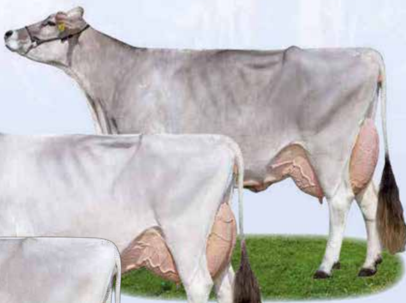
Bradley Nudi - Bisnonna / Urgroßmutter