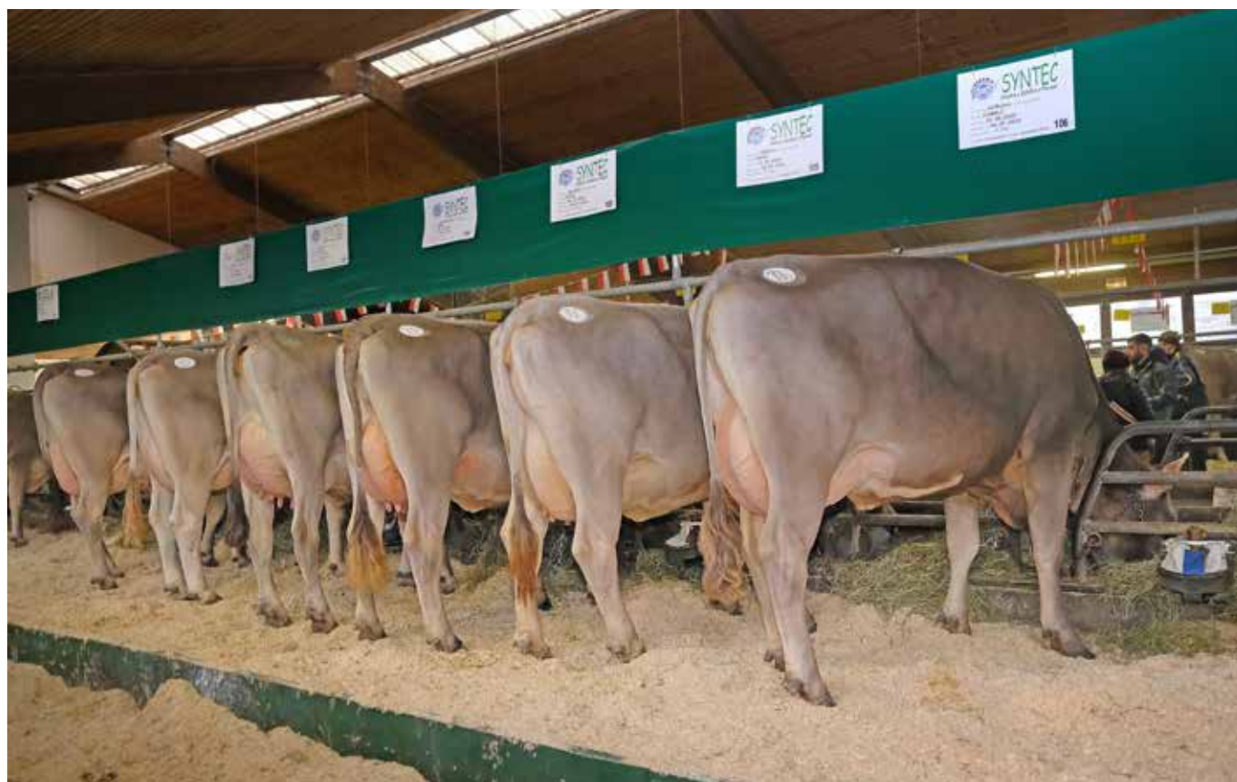
Il bel gruppo delle figlie del toro SB Syntec, vacche tutte molto forti e robuste.