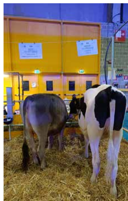
Alcune delle vitelle esposte alla Fiera di Cremona dagli allevatori trentini