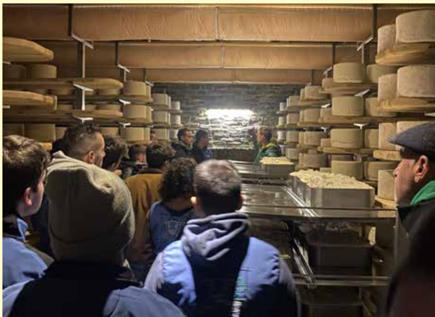
I locali di stagionatura del Castelmagno da Fiandino

Il viaggio è iniziato con la visita all'allevamento Scotta a Saluzzo in provincia di Cuneo, storica azienda di frisona, a conduzione familiare con l'aiuto di 3 dipendenti. Ad oggi sono allevate 200 vacche in latte, con ottime produzioni e per questo motivo è stato premiato come Master Breeder per produzione di latte, morfologia, CSS, e longevità, all'ultima mostra nazionale a Montichiari. Nonostante le strutture adatte ad una prima costruzione degli anni '80, i ragazzi sono stati colpiti per l'ottima gestione e benessere degli animali, oltre alle strepitose produzioni. Dopo un veloce pranzo in zona il gruppo si è trasferito nelle colline del cuneese, a Monterosso Grana per visitare un allevamento