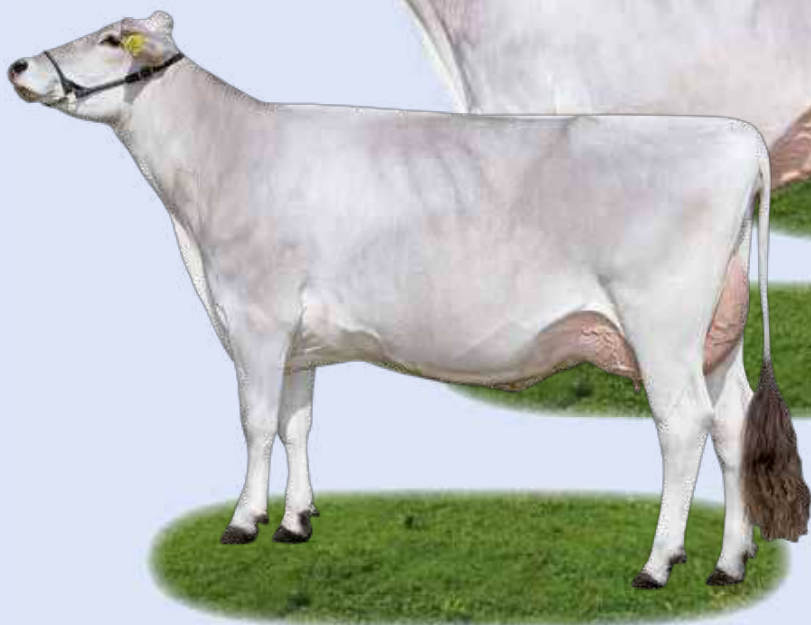
Assay Nusse - Nonna / Großmutter